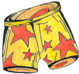
سِرْوَال السِّبَاحَة [siruāl as-sibāha]