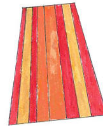
مِنْشَفَة الحَمَّام [minshafat al-hammām]